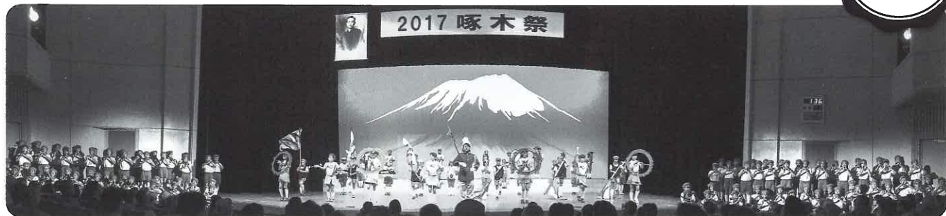
汲民小学校鼓笛隊