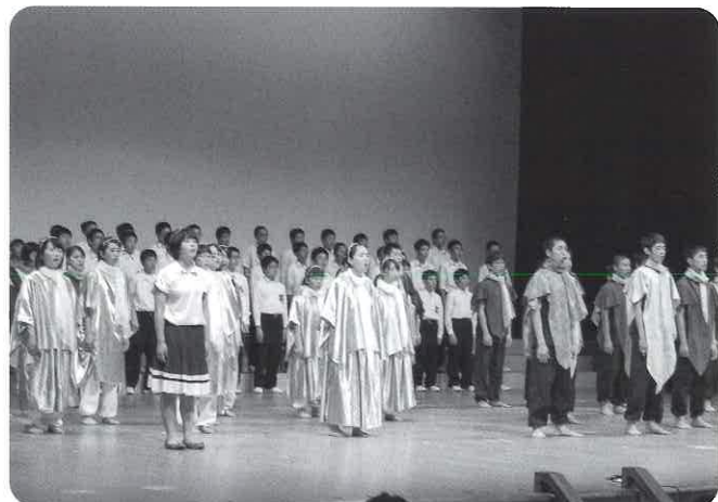
汲民中学校群読劇