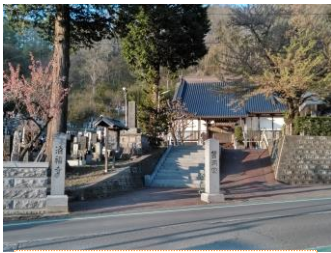
①啄木が徴兵検査を受けたお寺