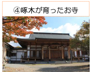
④啄木が育ったお寺