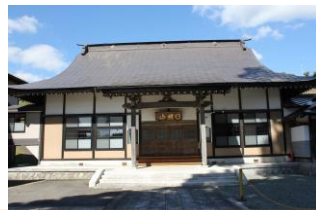
③啄木が生まれたお寺