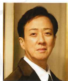
芸術監督 兼 演出：坂東 玉三郎

全席指定 《前売料金》S席 5,000円 A席 4,500円 B席 4,000円 (当日各500円増) 《m-Friends 料金》S席 4,500円 A席 4,050円 B席 3,600円 (前売のみ / 1会員2枚まで)