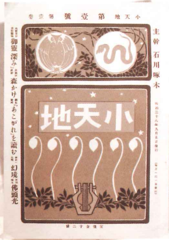
『小天地』 明治38年刊行