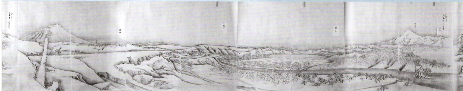
啄木の故郷・浪民近郊の風景 川口月村筆「奥羽寒図記」より 明治24(1891)年頃【岩手県立博物館蔵】