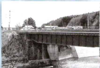
開業当初の面影を残す 鉄道遺構

現在はIGRいわて銀河鉄道として運行されている盛岡・目時間沿線には、今も現役の鉄道遺構が存在。 (右)松川橋梁 盛岡市 (左)第九馬淵川橋梁 二戸市