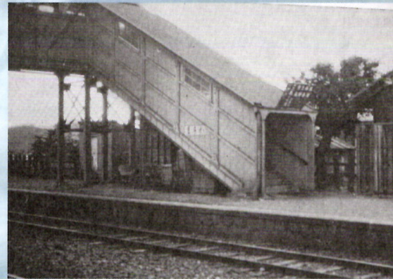
啄木が利用した好摩駅 啄木が暮らしていた頃はまだ浪民駅が無く、この駅が最寄り駅だった。2021年9月で開業130年となる