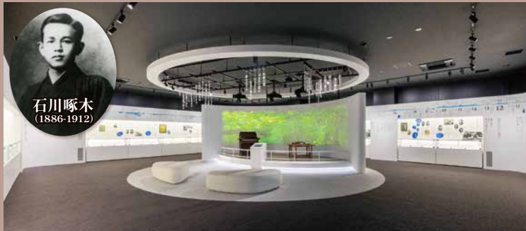
石川啄木記念館 展示室