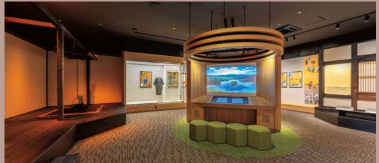
盛岡市玉山歴史民俗資料館 展示室