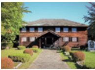
▲旧洪民尋常小学校