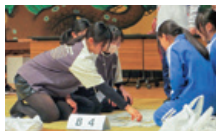
▲啄木かるた大会(毎年2月開催)

〒028-4132 盛岡市洪民字洪民9 TEL 019-683-2315 FAX 019-683-3119 E-mail inf0_takub0ku.0413@mfca.jp 休館日:月曜日(祝休日の場合は翌平日) 他臨時休館あり