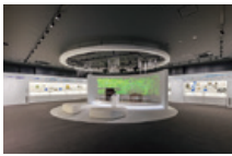
▲全面リニューアルした常設展示室

展示室には、啄木が弾いたオルガンや遺品、てがみなどの資料があります。また中庭には、啄木が学び教えた旧洪民尋常小学校や家族で暮らした茅葺屋根の建物が移築保存されています。