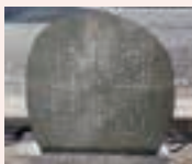
青森県八戸市の歌碑

・所在地/盛岡市浜民字浜民9 TEL019-683-2315 ・休館日/毎週月曜日(6月の休館日は1、8、15、22、29日)