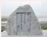
陸前高田市の歌碑