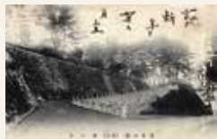
絵巻書「岩手公園 西入口」

盛岡市内にある建造物や彫刻、文学碑などを採り上げ、それに関連する人物について紹介します。